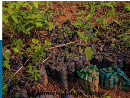
Champs Linga Congo